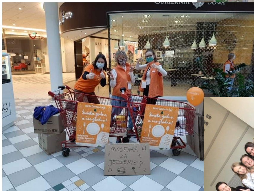
Zbiórka żywności dla osób biednych na święta