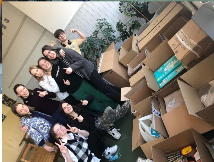
Pakowanie artykułów dla uchodźców z Ukrainy