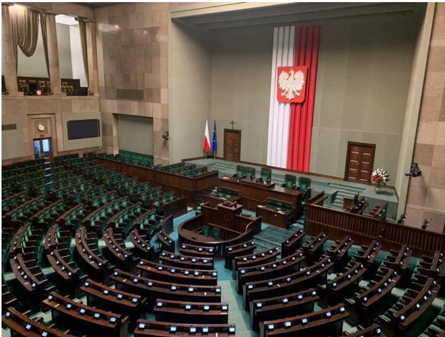
Wizyta w Sejmie RP 18.11.2022