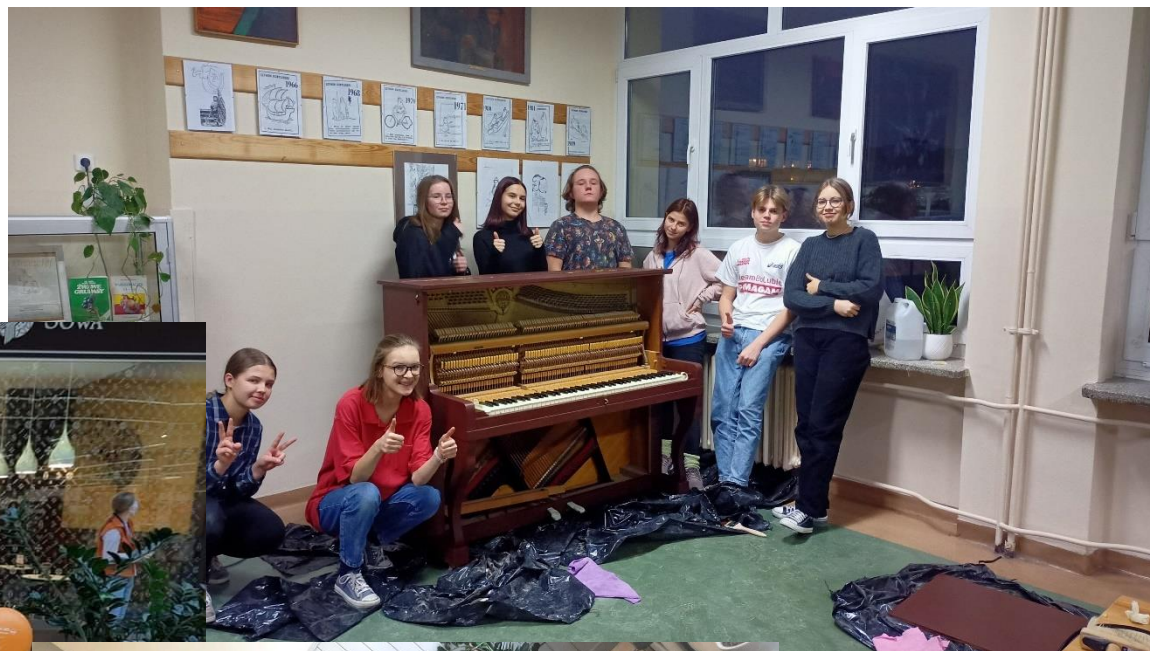
Przemaalowanie szkolnego pianina