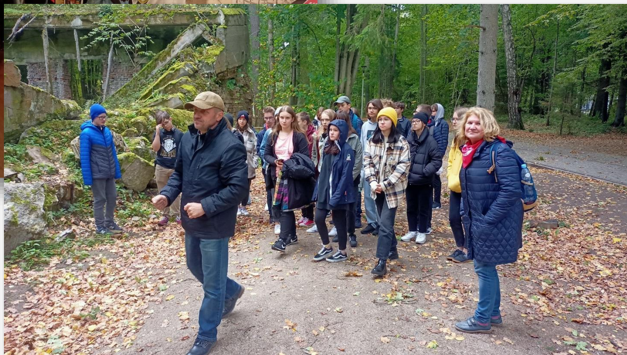
Wizyta w „Wilczym Szańcu”