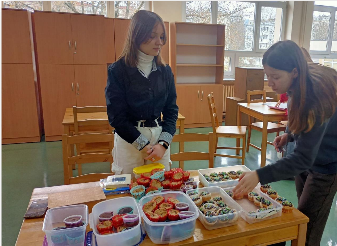
Akcja „Babeczki z nieprzygotowaniem”, z których dochód szedł na sierociniec we Lwowie