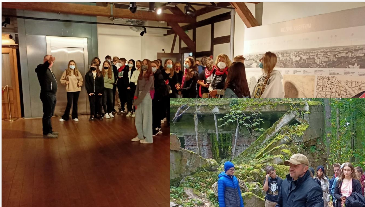
Wizyta w Olsztyńskim muzeum elektryczności